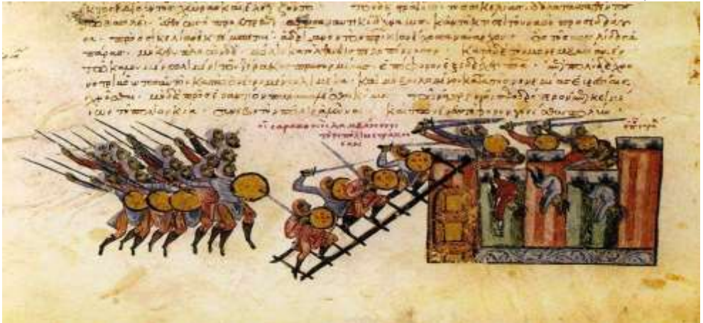
شكل رقم (٣) تمثل المعارك مع الايطاليين اثناء دخول الفاطميين الى جزيرة صقلية (٥٧)

أذ دخل ابن حوقل الى صقلية فترة حكم الولاة الكليبيين فيها، وقد ذكر انطباع سيء عن اهالي صقلية (٥٤) فقد ورد عن لسانه: "وكنت بها-أي صقلية-في سنة (٣٦٢هـ/ ٩٧٢م).....وقد استوفيت وصف هؤلاء وحكاياتهم ووصف .....صقلية ثم ذكرت ما هم عليه من سوء الخلق والمأكل والمطعم المنتن والاعراض الفذرة وطول المرء مع أنهم لا يتطهرون ولا يصلون ولا يحجون ولا يزكون،.....ومع هذا فالقمح لا يحول عندهم وربما ساس في البيدر لفساد هوائها، وليس يشبه وسخهم وقذرهم وسخ اليهود، ولا ظلمة بيوتهم سواد الأتاتين [أتون: موقد كبير، موقد نار الحمام "أشعل أتون الحمام]، وأجلهم منزلة تسرح الدجاج على موضعه وتذرق على مخدته وهو لا يتأثر" (٥٥) ، علماً ان ابن حوقل زار العاصمة بلرم فقط ولم يزر بقية مناطق صقلية (٥٦) .