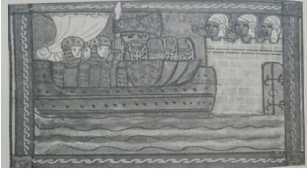
شكل رقم (٤) تمثل النورمان والمسلمين في صقلية (٦٤)