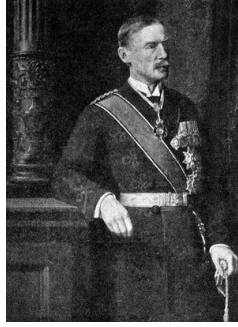
السير هنري مكماهون