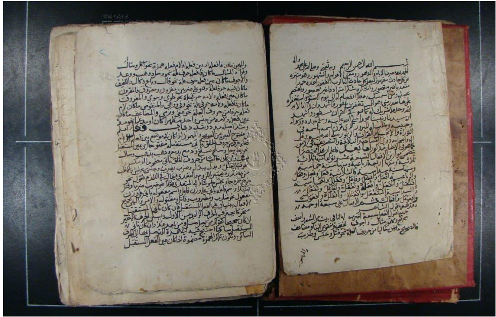
( الصورة الأخيرة لنسخة الأزهرية الأولى - نسخة الأم )