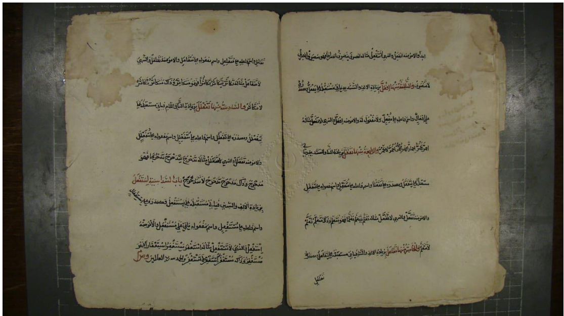
( الصورة الأولى لنسخة عارف حكمت )