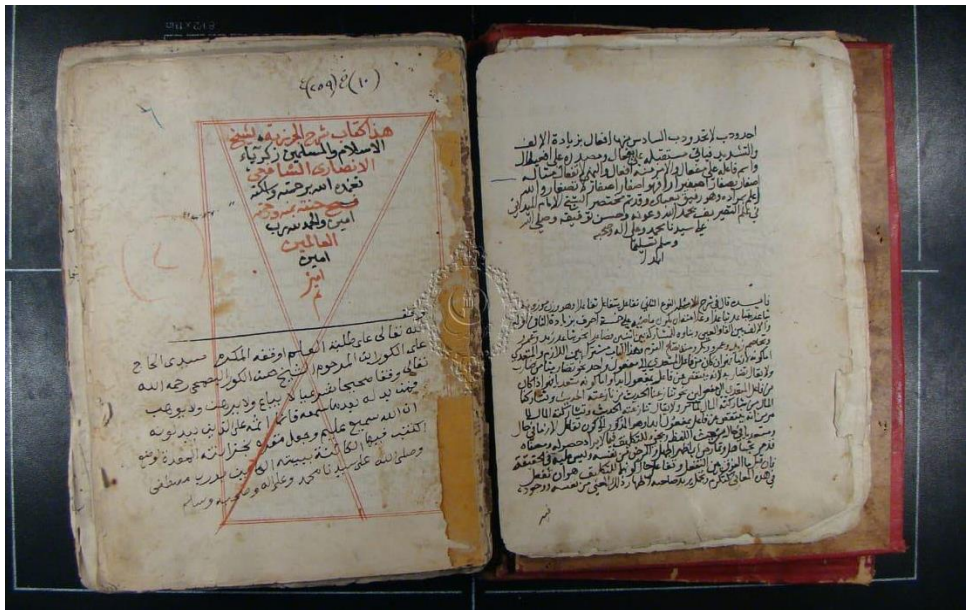
( الصورة الأولى لنسخة الأزهرية الثانية )