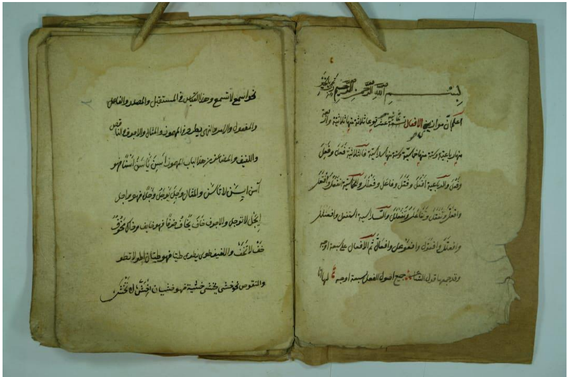
( الصورة الأخيرة لنسخة جامعة الإمام محمد بن سعود )